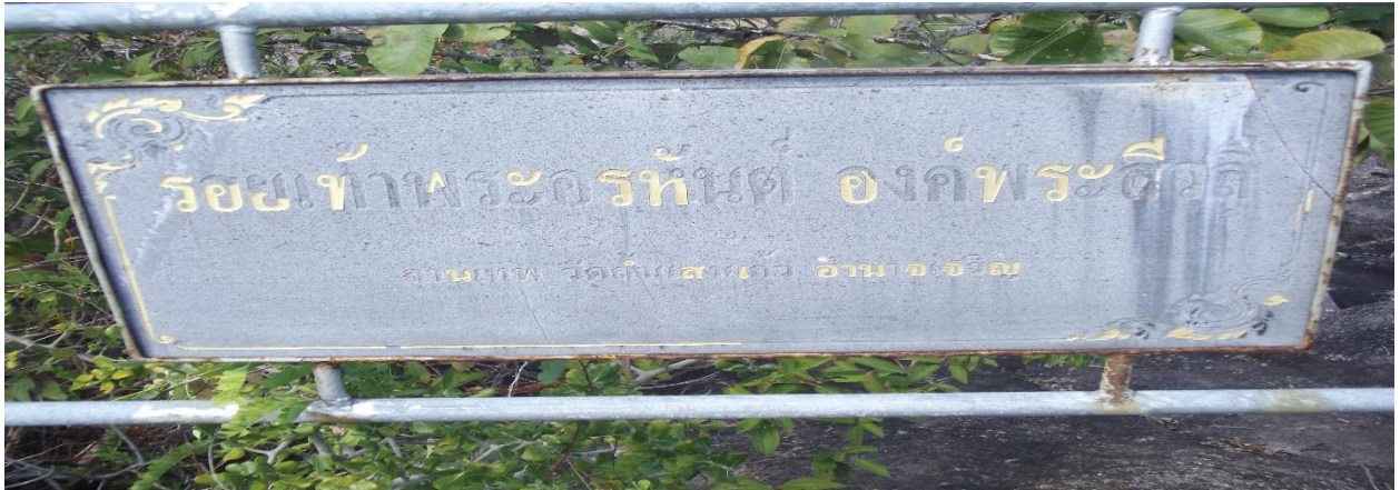
รอยเท้าพระอรหันต์