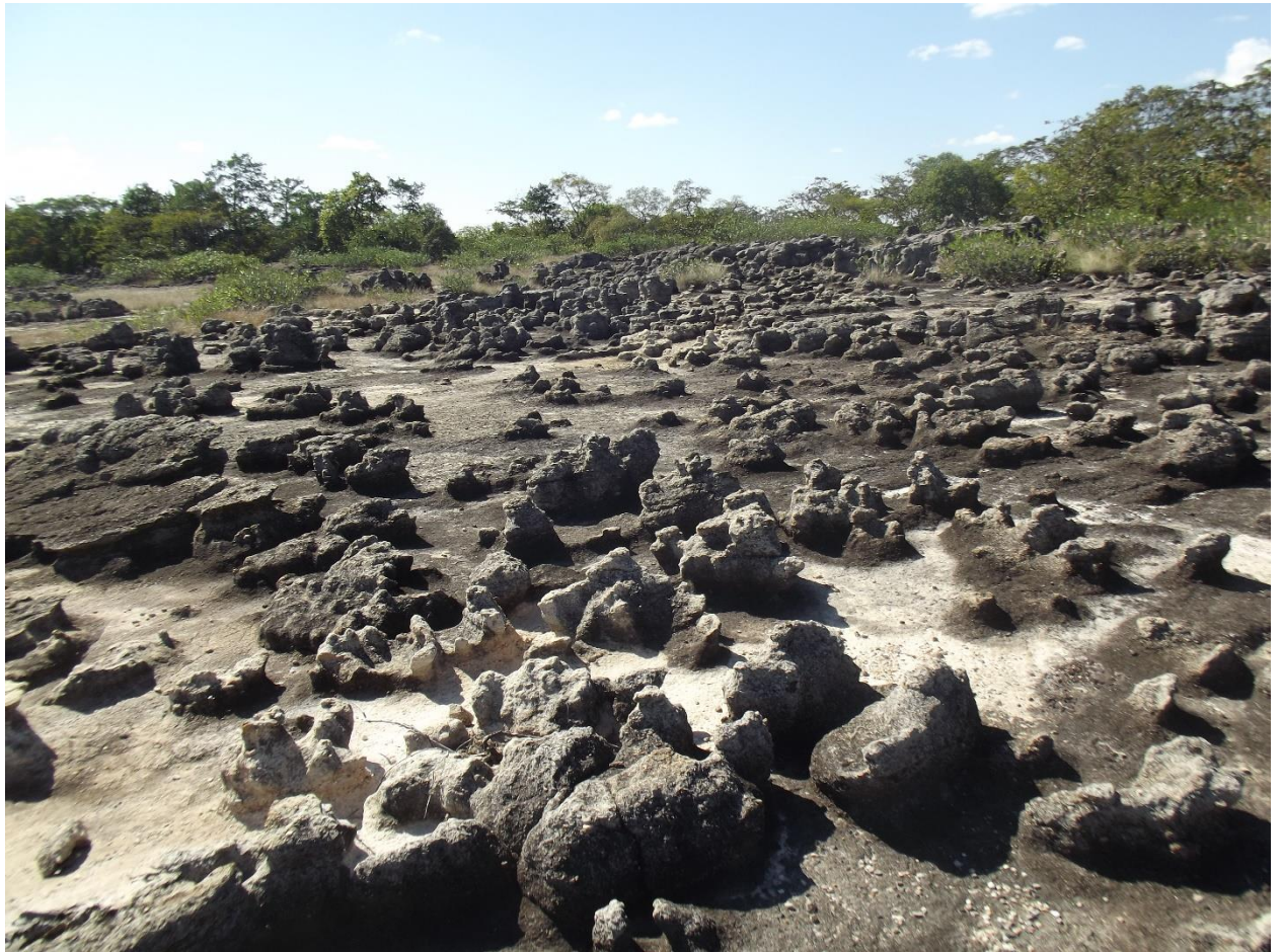
บทที่ ๓ การวิเคราะห์ศักยภาพและเป้าหมายการท่องเที่ยว